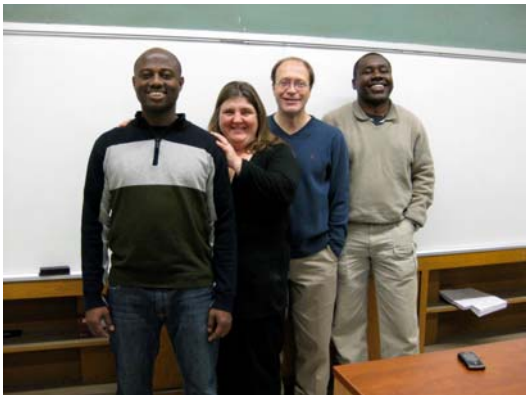
Quelques étudiants de la formation en vente-conseil de l'ÉMICA.

Quant au programme en soutien informatique, il mène à des emplois de service dans le domaine informatique. L'ÉMICA reçoit régulièrement des demandes d'entreprises à la recherche de personnes qualifiées dans ce domaine.