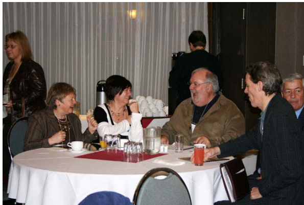
Au programme de la journée : atelier, échanges et présentations des grandes lignes de la théorie sur les représentations sociales selon l'axe personne handicapée/employeur.

On demeure toutefois un peu sur sa faim quant aux façons de concrétiser de manière éprouvée la théorie des représentations sociales. On évalue aussi que la durée des activités n'était pas suffisante pour couvrir, selon ce que nous avons planifié, l'ensemble des aspects proposés dans l'ordre du jour.