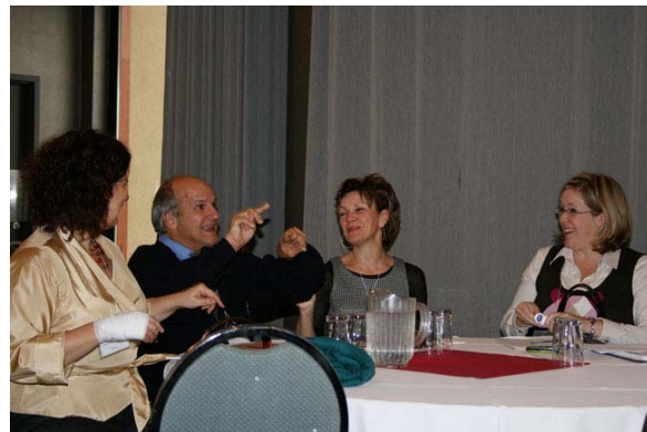
Les partenaires ont partagé leurs expériences et leur questionnement quant à la transformation des représentations sociales.

Ce sujet demeure vaste et complexe à cause des variables qui sont en présence. L'expérimentation en cours de réalisation dans la région du Bas-Saint-Laurent fait d'ailleurs ressortir l'à-propos et l'importance d'aborder les représentations sociales dans une perspective systémique qui met non seulement en relation un ensemble de facteurs mais différents niveaux d'intervention, du local au national.