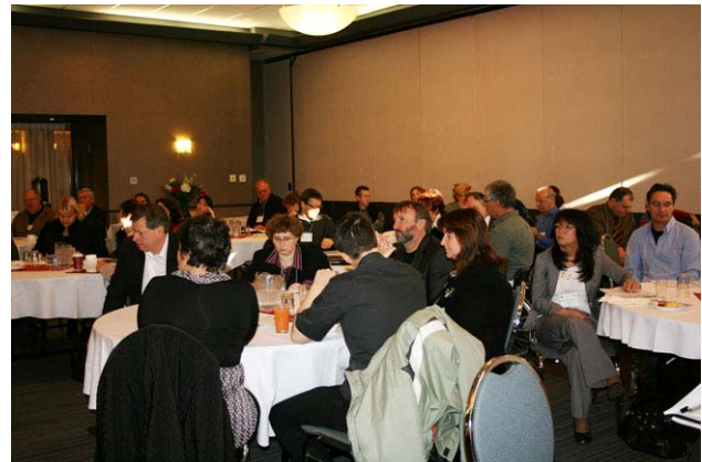
La rencontre annuelle des partenaires régionaux portant sur les représentations sociales a réuni 75 participants provenant de différentes régions du Québec.

Soixante-quinze représentants de différentes régions du Québec ont accepté notre invitation. Les échanges auront permis non seulement de valider l'hypothèse mise de l'avant mais d'enrichir les réflexions amorcées lors de notre dernière rencontre en mars 2007.