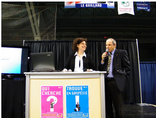
Le CAMO présentait une conférence lors du Rendez-vous emploi, formation et entrepreneuriat à Chandler en mai dernier.

Les 1 e et 2 mai derniers se déroulaient le Rendez-vous emploi, formation et entrepreneuriat au Centre sportif Clément-Tremblay de Chandler. Cette activité, financée principalement par Emploi-Québec, était organisée par la Chambre de commerce du Rocher-Percé et ses partenaires socio-économiques. Le CAMO pour personnes handicapées y participait, à l'intérieur d'un regroupement concerté réunissant SPHERE-Québec, l'Office des personnes handicapées du Québec, le projet Travaillons ensemble du Regroupement des organismes spécialisés pour l'emploi des personnes handicapées (ROSEPH) et de la Fédération des travailleurs et travailleuses du Québec (FTQ), Emploi-Québec, l'association La joie de vivre inc, le Regroupement des associations des personnes handicapées de la Gaspésie (les Îles), l'entreprise adaptée Les Ateliers Actibec 2000 inc. et le SSMO Gaspésie-les-Îles.