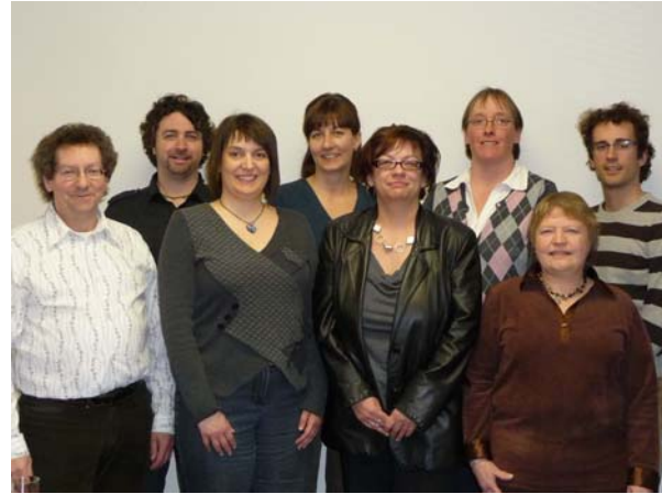
Les membres de la Table Jamésienne pour l'intégration et le maintien en emploi des personnes handicapées.

l'organisme Partenaires à parts égales de Lebel-sur-Quévillon, de Service Canada, du Service externe de main d'œuvre du Lac-St-Jean et de la Commission scolaire de la Baie-James.