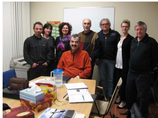
Le groupe de travail en lien avec la Stratégie.

Dans le but de rendre opérationnelle cette stratégie et de l'arrimer aux besoins spécifiques des personnes handicapées de la région, un groupe de travail a été mis sur pied. Il regroupe l'Office des personnes handicapées du Québec, Emploi-Québec, les services externes de main-d'œuvre de la région, le CAMO pour personnes handicapées, SPHERE-Québec et le Groupement des organismes de personnes handicapées du Saguenay.