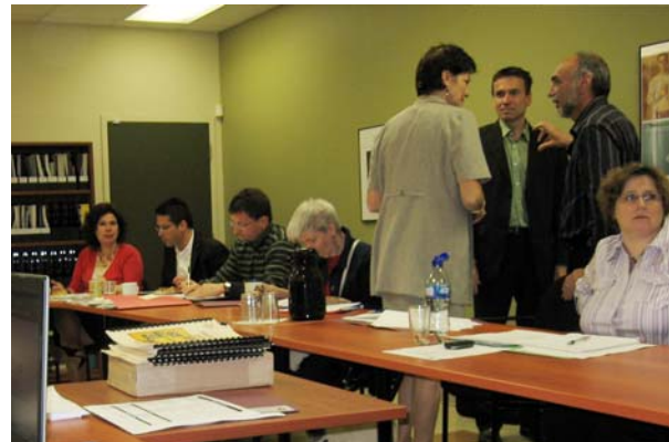
Plusieurs représentants d'entreprises étaient présents lors de l'assemblée générale annuelle du CAMO.

Nous avons poursuivi notre travail d'élargir notre réseau d'entreprises qui se donne la mission de développer et de partager des pratiques en matière de gestion de l'équité dans le contexte de l'intégration et du maintien en emploi des personnes handicapées. Nous comptons actuellement sur l'implication de 21 entreprises dans ce réseau.