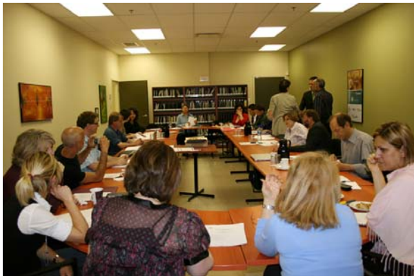
La 14 e assemblée générale annuelle du CAMO se déroulait le 27 mai dernier.

Nos réalisations de l'année se regroupent autour de trois thèmes principaux : notre présence marquée tant dans le secteur de la formation que celui de l'emploi, notre détermination à exercer un rôle d'influence et nos efforts de concertation de plusieurs partenaires.